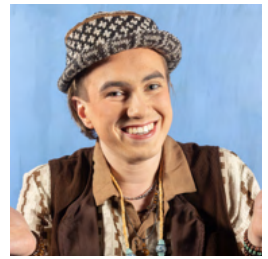
Oliver Alí Ljónið/Asninn/Úlfaldinn/Dýrasalinn